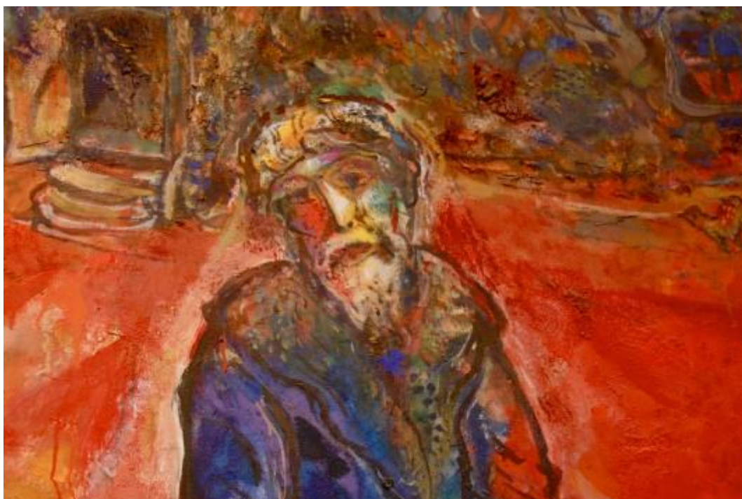
M. Chagall, Abramo (particolare)